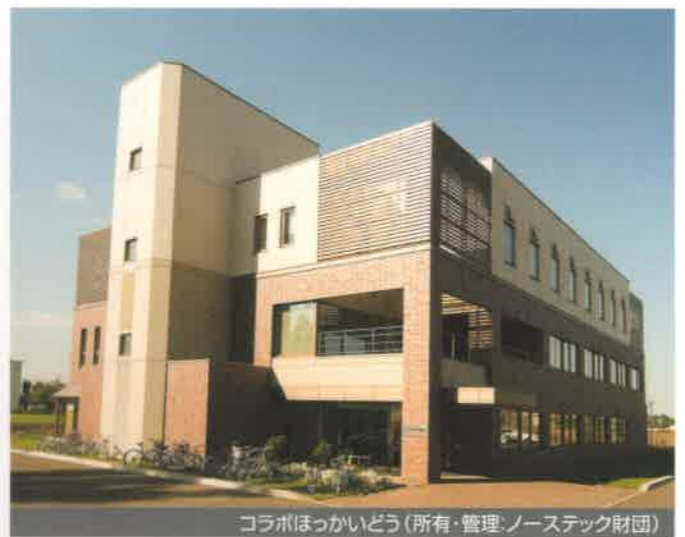
コラボほっかいどう(所有・管理:ノーステック財団)

研究開発から事業化まで一貫して支援します! ノーステック財団は北海道産業の振興と活力ある地域経済の実現、そして道民生活の向上を目的として、科学・産業技術の振興に関する事業を総合的に推進する財団です。技術の振興発展を基盤から強化しながら、研究開発から実用化・事業化まで一貫した支援を行います。組織は、民間からの出向者を中心に(職員63名、うち出向者34名)、4部3室1研究所で運営しています。