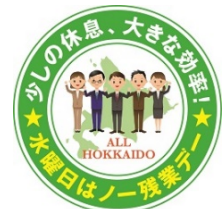
「ノー残業デー」 取組み図案