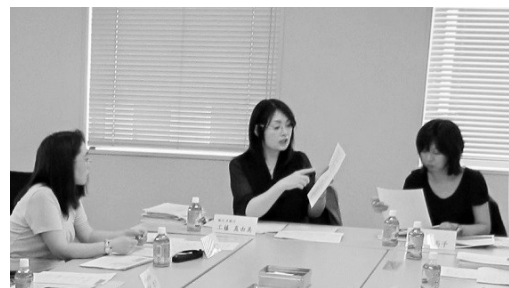
(第5回)提案書のまとめに向けて、熱心な検討が続きました