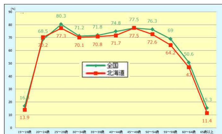
女性の年齢階級別労働力率（平成27年） 北海道と全国と比較