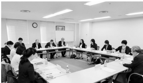
(第1回)冒頭、森専務理事より、PTへの期待を込めた挨拶がありました