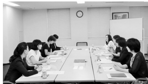
(第1回)机を組み替え、早速メンバーによる検討を開始しました