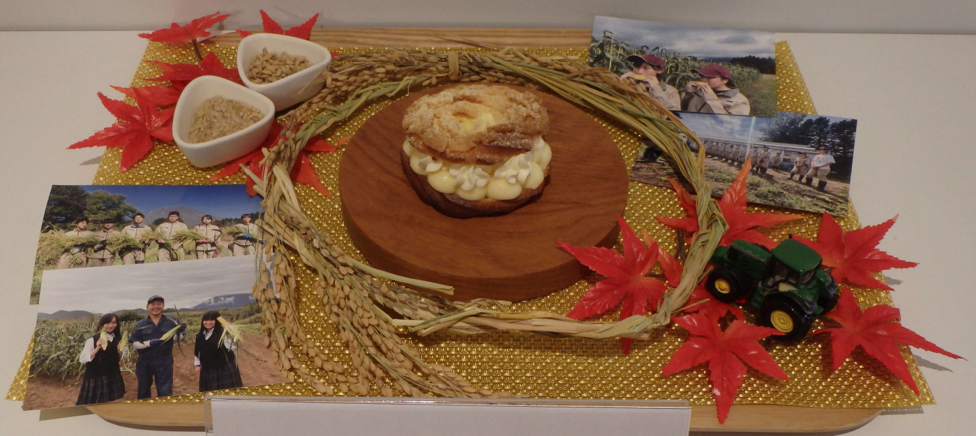
お米とうきびパリブレスト